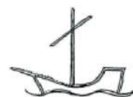
Sct. Nicolai Kirke