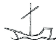
Sct. Nicolai Kirke